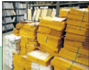
Pacchi di ricorsi in via Ostiense