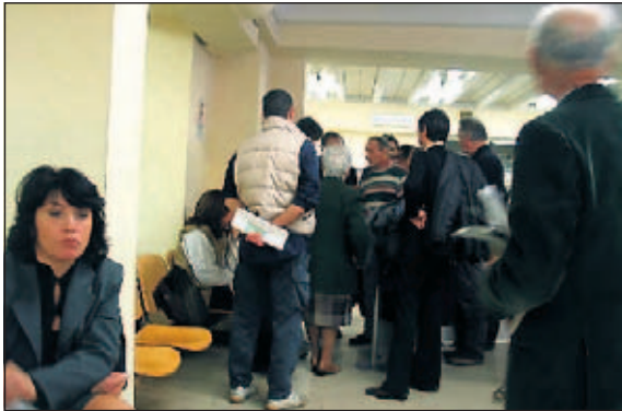
File lunghissime all'ufficio multe di via Ostiense per le cartelle che minacciano il "fermo auto". In tanti casi le persone hanno pagato

Gente che spinge, c'è chi chiede dove si prende il numeretto. Chi si scoraggia vedendo che ha 145 persone davanti a lui. Chi impreca, urla, scalcia contro le porte. Un girone dantesco nella stanza forse più odiata dai romani: l'ufficio contravvenzioni di via Ostiense. Una situazione che ormai è al collasso. Dove ogni giorno i cittadini sono costretti a lunghissime attese per far valere i propri diritti. Già, perché proprio in questi giorni sono arrivate nelle case dei romani le raccomandate spedite dalla Gerit: avvisi di mancato pagamento che impongono il fermo amministrativo del mezzo. Fin qui nulla di strano. L'anomalia sta nel fatto che gran parte di queste cartelle esattoriali sono da annullare: nel calderone infatti sono finite anche contravvenzioni pagate (il periodo più "incriminato" è quello dell'anno 1995), ricorsi effettuati e mai notificati come persi, persino cause vinte e giudicate dal Giudice di Pace. Centina-